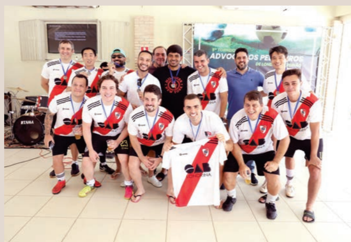
River Plate, 3º lugar.

Os patrocinadores foram: Unimed, CAAPR, JE Leilões, Disk Chopp Stainski, SKS Comunicação Visual, Freitas e Leonardi Advogados Associados.