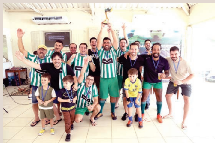
Atlético Nacional Medellín, 2º lugar.