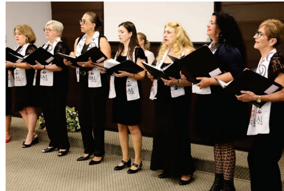
O Coral da OAB-Londrina encantou a todos com sua apresentação na abertura do congresso.