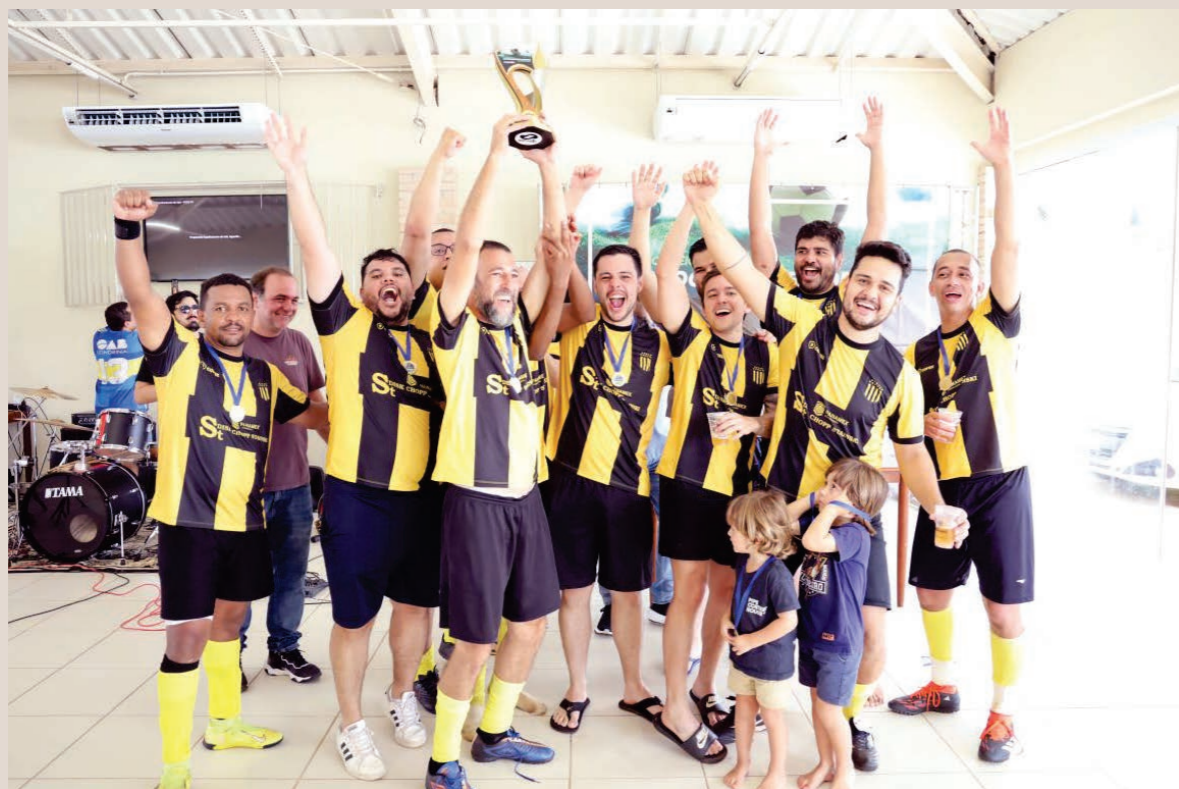
Peñarol, 1º lugar.